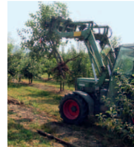
Rodung befallener Apfelbäume