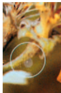
Bakterienschleimtropfen am Blütenstiel