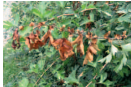
Mit Feuerbrand befallener Weißdorn

Bei nachgewiesenem Feuerbrandbefall legt die zuständige Behörde Bekämpfungsmaßnahmen in einem Bescheid fest.