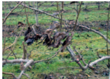
Im Winter anhaftendes Laub nach Infektion durch Feuerbrand