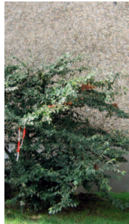
Cotoneaster salicifolius mit Feuerbrand