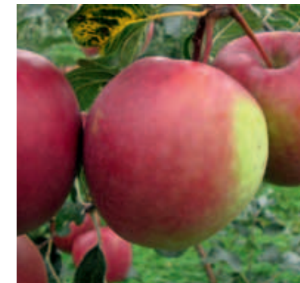
'Rewena', resistent gegen Feuerbrand