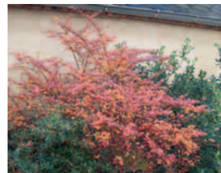
Alternative Pflanzen: Berberis candidula , Berberis thunbergii , Ilex aquifolium mit ähnlichen Wuchseigenschaften