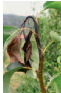
Nach Infektion abgestorbener Langtrieb an Birne